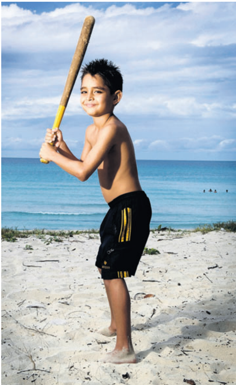
Cuba, het strand van Varadero.