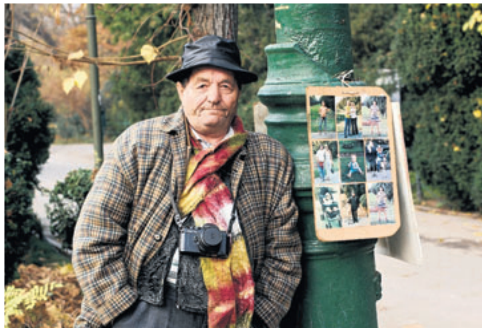
Straatfotografie als bijverdienste van gepensioneerde Roemeen.