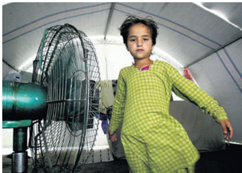
Warmte in een tent in Pakistan.