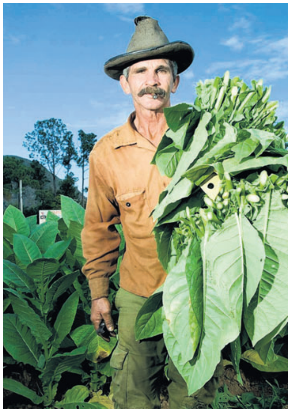
Tabaksveld in Guatemala.