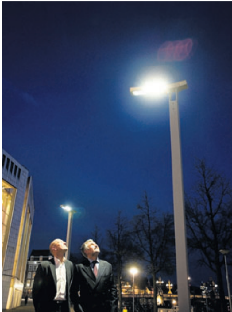
In 2007 stapte toenmalig wethouder Herrema (l) in leds, met Philips.

Maar led is niet zaligmakend. Het is volgens Koerselman een groot misverstand te denken dat led de enige energiezuinige verlichting zou zijn. "Bestaande conventionele